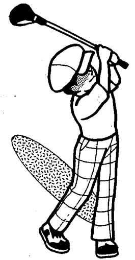
ミシガン会6月度トーナメント 成績表 (6/18/06)