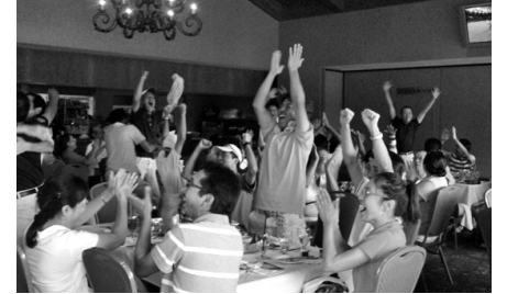
なでしこJapan優勝の瞬間